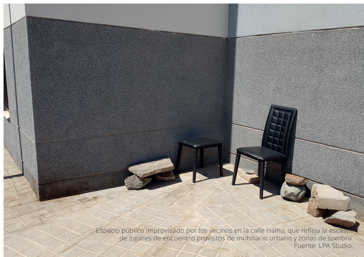
Espacio público improvisado por los vecinos en la calle Hama, que refleja la escasez de lugares de encuentro provistos de mobiliario urbano y zonas de sombra.